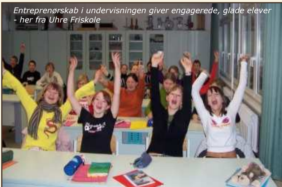
Entreprenørskab i undervisningen giver engagerede, glade elever - her fra Uhre Friskole

Uhre Friskole arbejder videre med "Vilde ideer" i en konkurrence udskrevet af Unge forskere. Erfaringerne er, at det er en dårlig ide, at eleverne skal arbejde alene, og der er behov for at arbejde med realitets-