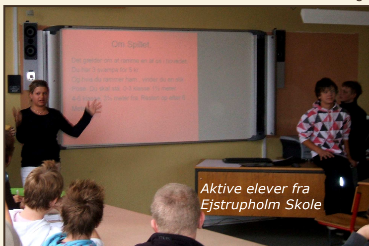
Aktive elever fra Ejstrupholm Skole

Proceskonsulenternes opgaver er at inspirere og holde oplæg for kolleger ud fra progressionsmodellen, både på egen skole, men også på kurser og oplæg på andre skoler.