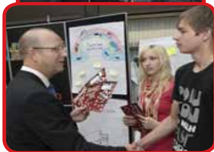
Billeder fra dagen