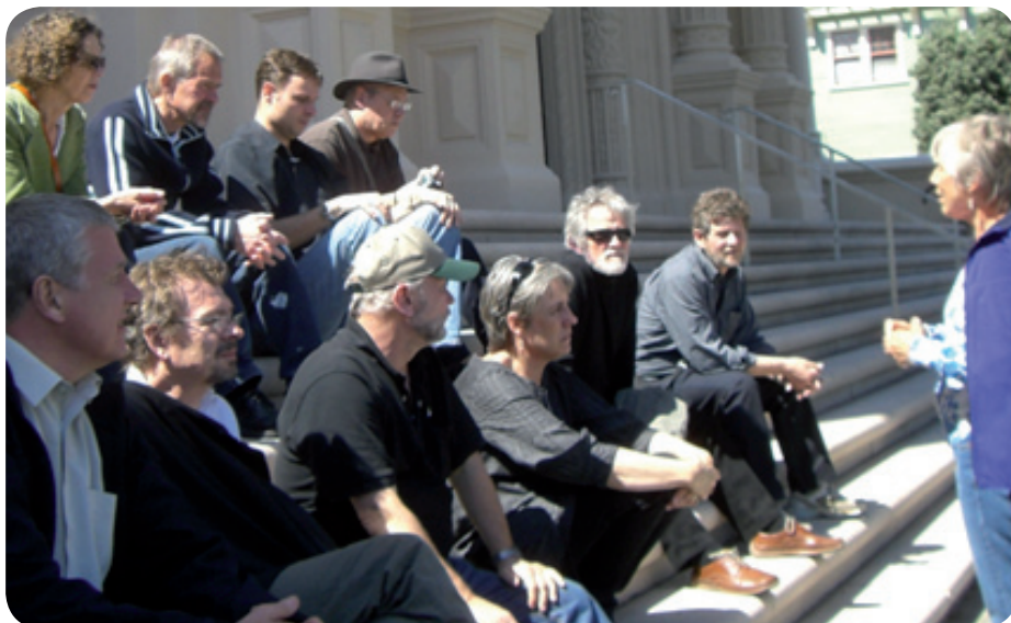
Briefing omkring turen

Stedet hvor børns læring bygger på kreativitet og innovation