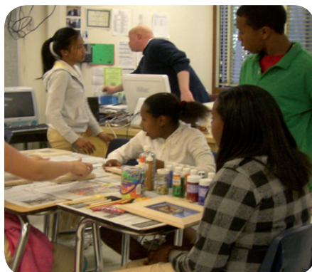
Elever fra Middle School dekorerer rammer til deres business

Eleverne på Middle School skulle lave deres egen business. Det hold, vi så, skulle dekorere rammer. De skulle i slutningen af skoleåret deltage i konkurrencer om at være de bedste entreprenører.