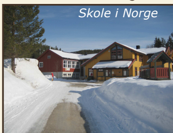
Skole i Norge

Åvos var det nogle af de visioner, der blev ført ud i