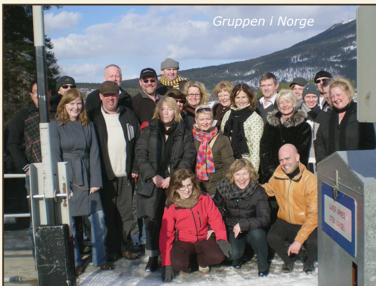
Gruppen i Norge

arbejdede i perioder af året med enten drift af et slusemuseum eller drift af et museum i forbindelse med en nedlagt mine. Den